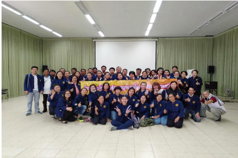
ภาพประกอบการจัดโครงการให้ความรู้ทางกฎหมายเกี่ยวกับการละเมิดและวินัย